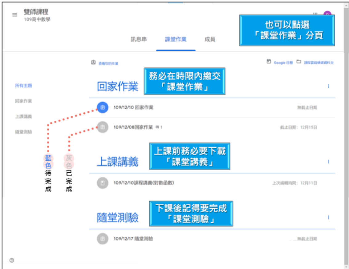
① 課堂講義：附檔讓同學下載講義及補充資料